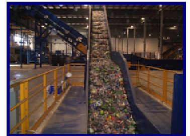
Les matières plastiques retirées du flux de déchets seront recyclées et réutilisées.

visions, les taux de réacheminement visés par notre installation se situeront entre 43 et 57 %.